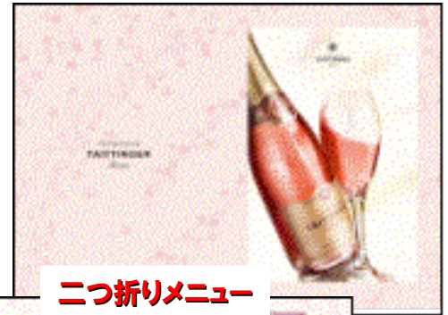
二つ折りメニュー