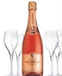
グラス ダミーボトル