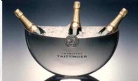
クーリングボール