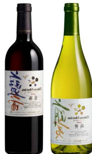
-シャトー・メルシャン アンサンブル 藍茜、萌黄 750ml