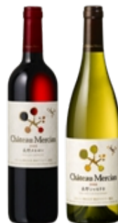
-シャトー・メルシャン 長野メルロー 長野シャルドネ 750ml