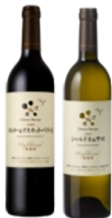
-シャトー・メルシャン 無濾過 メルロー&マスカット・ベリーA 無濾過 シャルドネ&甲州 750ml