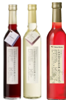
-シャトー・メルシャン 日本の地ワイン ・穂坂マスカット・ベリーA ・穂坂甲州 ・山梨マスカット・ベリーA ロゼ 500ml